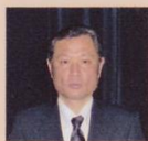
関東信越厚生局 指導監査課 医療指導監視監査官 松本 康明先生